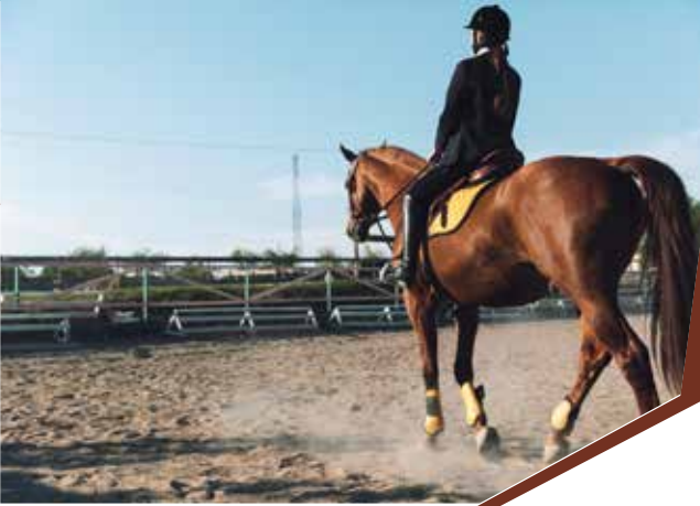
חוגי גיל ביה"ס היסודי